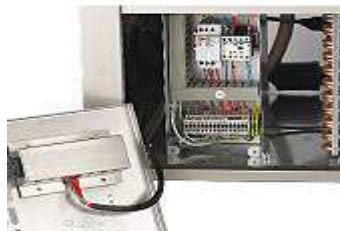
Tableau électrique accessible en façade Angles intérieurs rayonnés et arrondis. Joint de porte à lèvre, nettoyage facilité, démontage sans outil Siphon de cuve démontable facilement pour un nettoyage facilité Fond de cuve inox isolé équipé d'un siphon Ventilateur(s) démontable(s) facilement Mannequin frigorifique suspendu, accès 100 % de la surface au sol Tuyau d'évacuation des eaux à raccorder sur vidange ou bac Dégivrage par marche forcée des ventilateurs, arrêt automatique.