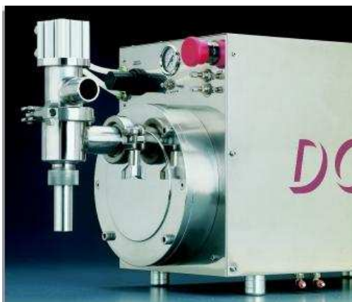
SOUPAPE DE DISTRIBUTION POUR PRODUITS SEMI-DENSES

Le corps de la DOSAMATIC volumétrique pneumatique DS912 et DS913 est séparé de la soupape et des divers accessoires.